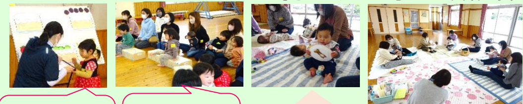
みんなでお祝いしてもらってうれしいな。