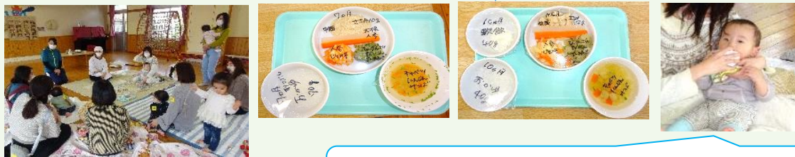
ゴックンゴックン、おいしいよ～

給食の先生に離乳食づくりで大切にしていることなどお話を聞きました。この日の中期と後期のサンプルです。