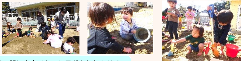
冬の間に大きくなった子どもたちもどろんこあそびに初挑戦です！