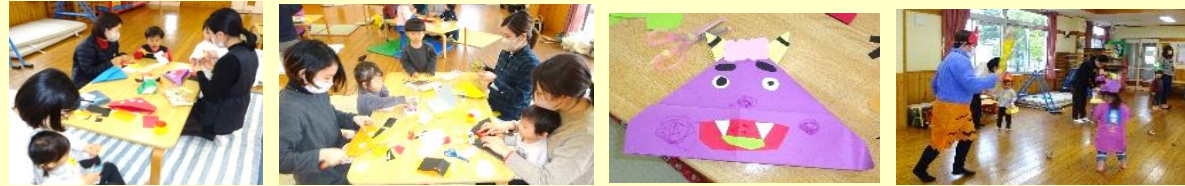
糊でペタペタ貼るのも上手になった

グループに分かれて鬼面作り。とってもユニークで個性豊かな鬼面ができました。新聞誌紙を丸めてお豆も作りました。その後、保護者さん扮する鬼が現れてびっくり！キャッキヤと喜んでと豆まきも楽しみました。