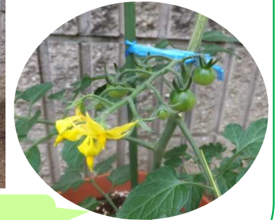
黄色いお花が咲いて、緑色のトマトの実もできました。