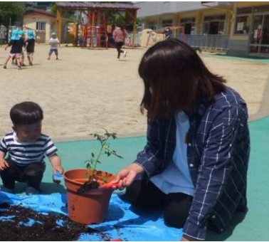
植えたミニトマトは、それぞれおうちに持って帰りました。トマトの実がなるまで育ててみてくださいね。