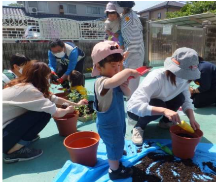
プランターに土を入れて、ミニトマトの苗を植えました。